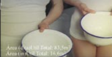
Área (dita) Util Total: 83,5m 2 Área (m) Util Total: 16,6anos