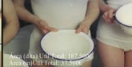
Área (dita) Util Total: 187,50m 2 Área (m) Util Total: 37,500anos