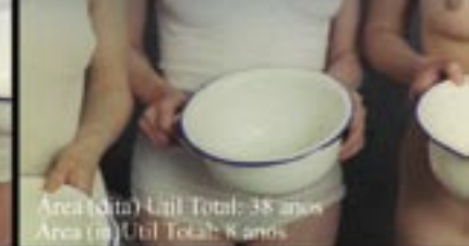
Área (dita) Util Total: 38 anos Área (m) Util Total: 8 anos