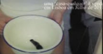
uma "casa-qualquer" à venda em Lisboa em Julho de 2011